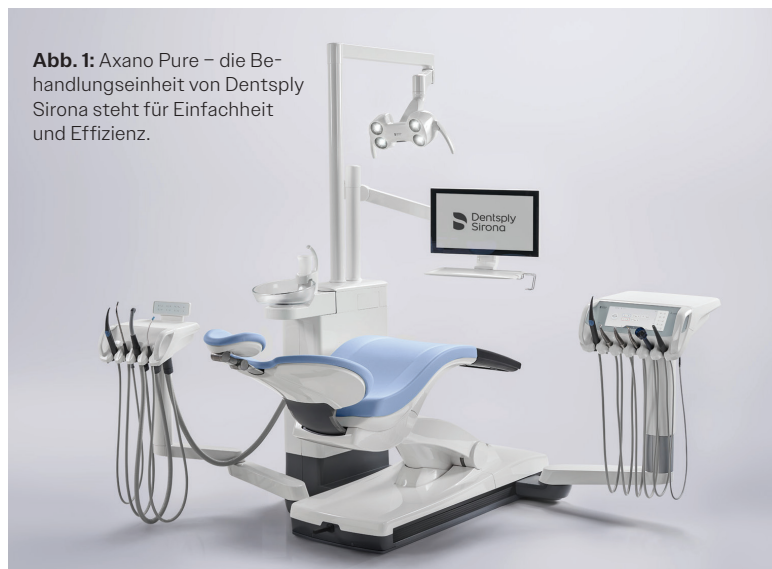
Abb. 1: Axano Pure – die Behandlungseinheit von Dentsply Sirona steht für Einfachheit und Effizienz.

Einfachheit, Effizienz und Innovation vereint – Jetzt bei Dentsply Sirona erhältlich.