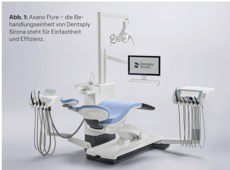
Abb. 1: Axano Pure – die Behandlungseinheit von Dentsply Sirona steht für Einfachheit und Effizienz.

Einfachheit, Effizienz und Innovation vereint – Jetzt bei Dentsply Sirona erhältlich.