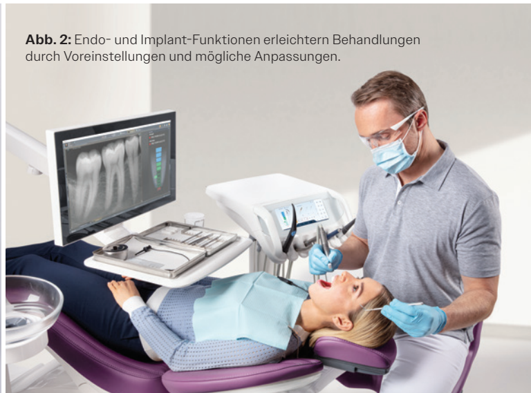
Abb. 2: Endo- und Implant-Funktionen erleichtern Behandlungen durch Voreinstellungen und mögliche Anpassungen.

* Belgien, Tschechische Republik, Deutschland, Frankreich, Großbritannien, Italien, Liechtenstein, Luxemburg, Niederlande, Polen, Norwegen, Finnland, Schweden, Dänemark, Spanien, Portugal und Island. Weitere Informationen erhalten Sie bei Ihrem regionalen Dentsply Sirona-Kontakt.