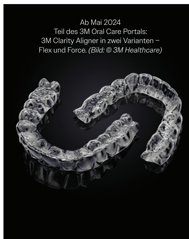
Ab Mai 2024 Teil des 3M Oral Care Portals: 3M Clarity Aligner in zwei Varianten – Flex und Force.

3M Clarity Aligner sind in zwei verschiedenen Varianten verfügbar: 3M Clarity Aligner Flex bestehen aus einem flexiblen, mehrschichtigen Material, mit dem sich Rotations- und Proklinationsbewegungen besonders gut realisieren lassen. Die einfache Einsetzbarkeit und Entnahme der Flex-Variante erleichtert Patienten den Start in die Aligner-Behandlung, außerdem ist sie für das Finishing gut geeignet. 3M Clarity Aligner Force sind aus einem festeren, ebenfalls mehrschichtigen Material gefertigt und damit prädestiniert für Expansionen, Torque, sequenzielle körperliche Bewegungen und segmentale Intrusion. Ob und wie die Varianten kombiniert werden, bleibt ganz dem Anwender überlassen.