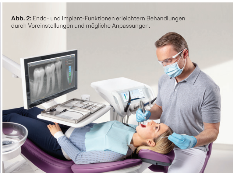
Abb. 2: Endo- und Implant-Funktionen erleichtern Behandlungen durch Voreinstellungen und mögliche Anpassungen.

* Belgien, Tschechische Republik, Deutschland, Frankreich, Großbritannien, Italien, Liechtenstein, Luxemburg, Niederlande, Polen, Norwegen, Finnland, Schweden, Dänemark, Spanien, Portugal und Island. Weitere Informationen erhalten Sie bei Ihrem regionalen Dentsply Sirona-Kontakt.