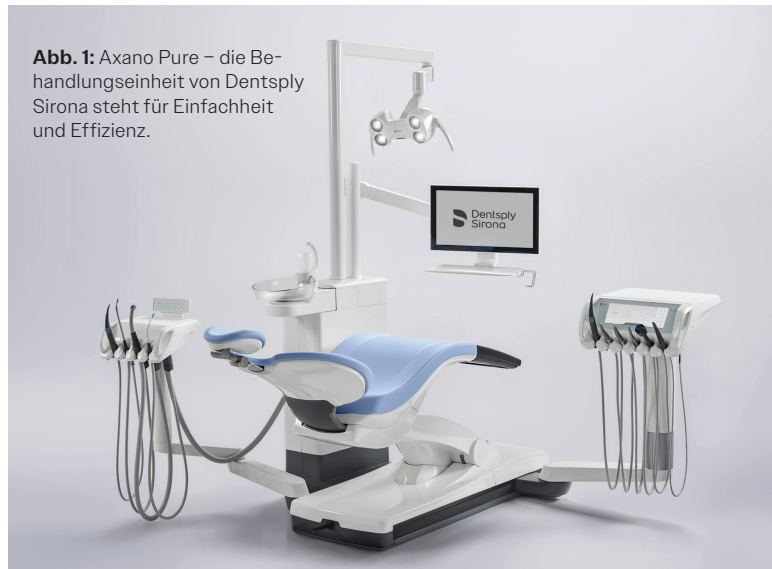
Abb. 1: Axano Pure – die Behandlungseinheit von Dentsply Sirona steht für Einfachheit und Effizienz.

Einfachheit, Effizienz und Innovation vereint – Jetzt bei Dentsply Sirona erhältlich.