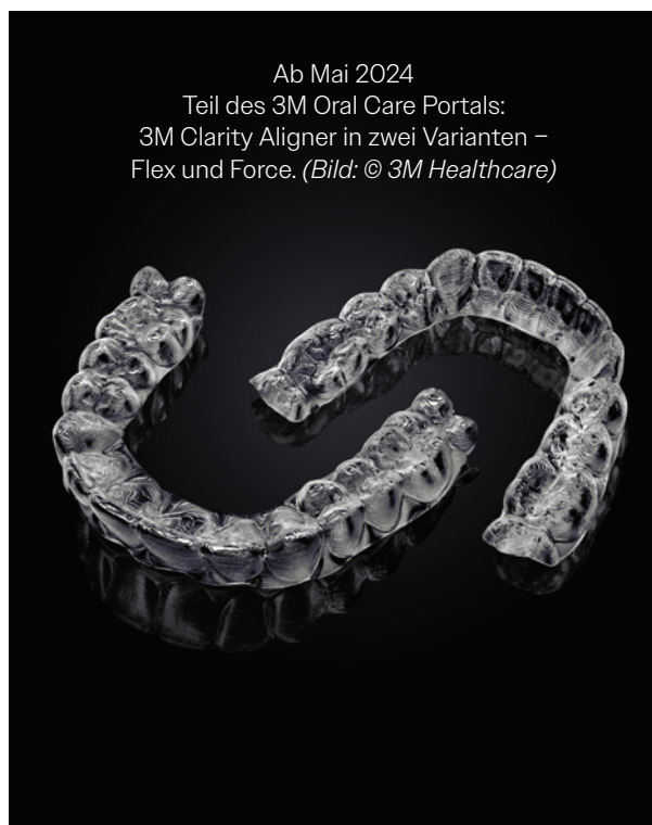
Ab Mai 2024 Teil des 3M Oral Care Portals: 3M Clarity Aligner in zwei Varianten – Flex und Force.

3M Clarity Aligner sind in zwei verschiedenen Varianten verfügbar: 3M Clarity Aligner Flex bestehen aus einem flexiblen, mehrschichtigen Material, mit dem sich Rotations- und Proklinationsbewegungen besonders gut realisieren lassen. Die einfache Einsetzbarkeit und Entnahme der Flex-Variante erleichtert Patienten den Start in die Aligner-Behandlung, außerdem ist sie für das Finishing gut geeignet. 3M Clarity Aligner Force sind aus einem festeren, ebenfalls mehrschichtigen Material gefertigt und damit prädestiniert für Expansionen, Torque, sequenzielle körperliche Bewegungen und segmentale Intrusion. Ob und wie die Varianten kombiniert werden, bleibt ganz dem Anwender überlassen.