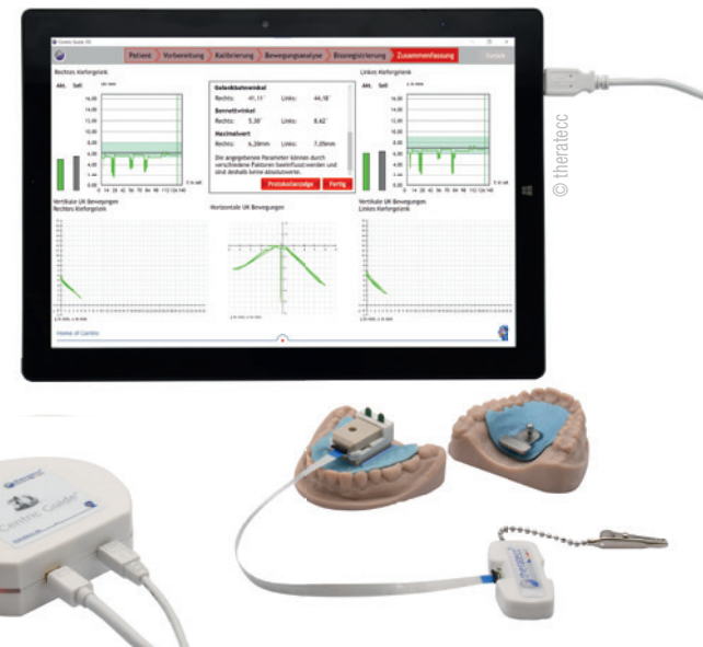
Abb. 1: Centric Guide® 3D hebt die Bissnahme auf ein höheres Niveau in den Bereichen der Vorhersagbarkeit und Effizienz.

therafaceline verfügt über zwei stufenlos höhenverstellbare Ohrlöcher und eine aufsteckbare Brille mit horizontalen Linien. Mit dieser Brille und den höhenverstellbaren Ohrlöchern kann der Gesichtsbogen parallel zur Bipupillarlinie am Kopf ausgerichtet werden. Gleiches gilt für die Camper'sche Ebene. Durch die Erfassung der