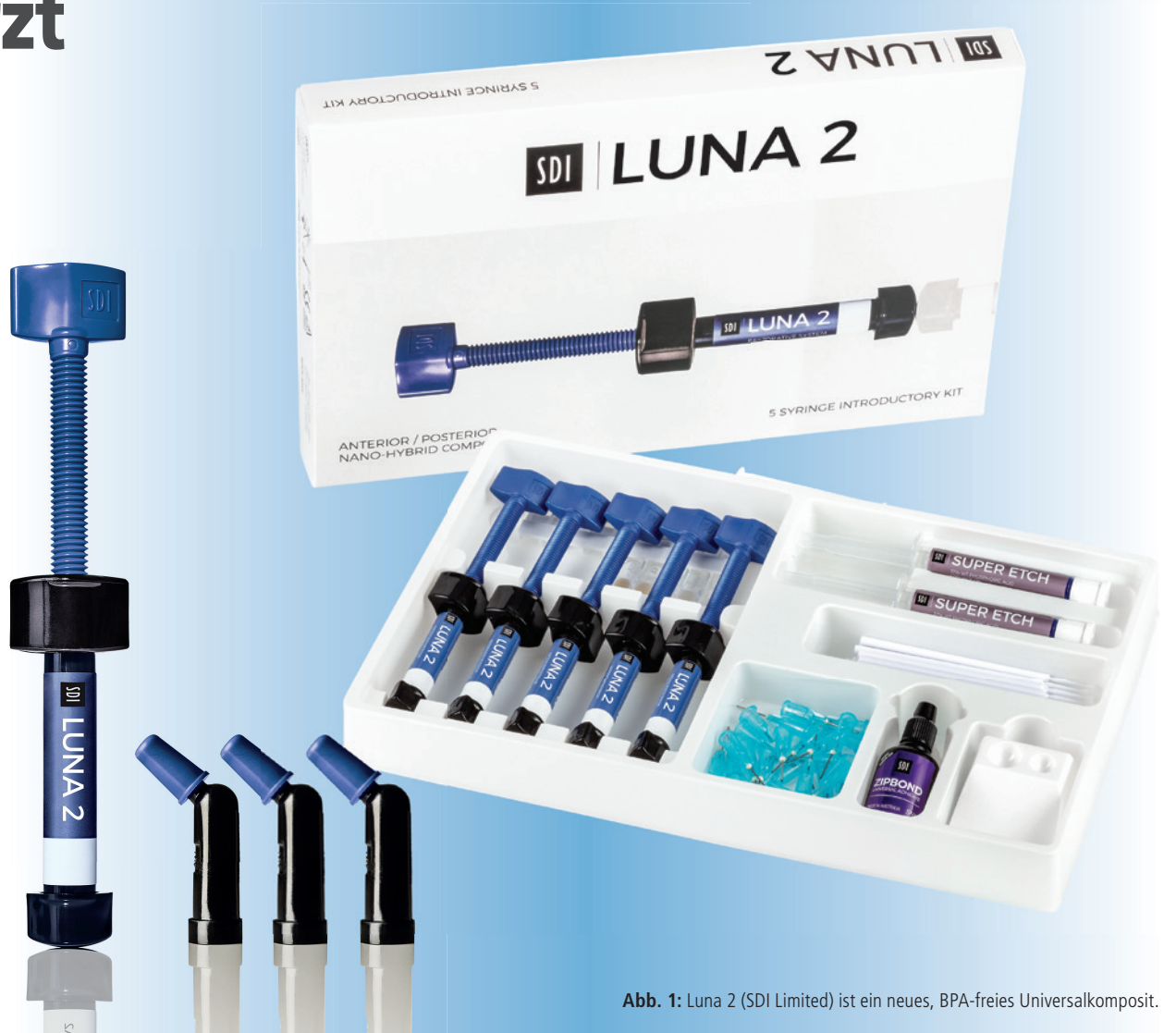
Abb. 1: Luna 2 (SDI Limited) ist ein neues, BPA-freies Universalkomposit.

Und damit nicht genug: Luna 2 harmoniert auch gut mit Luna Flow – dem neuen fließfähigen Universalkomposit von SDI.