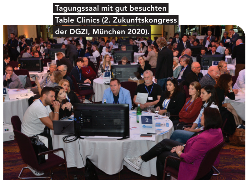
Tagungssaal mit gut besuchten Table Clinics (2. Zukunftskongress der DGZI, München 2020).