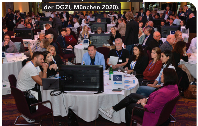
Tagungssaal mit gut besuchten Table Clinics (2. Zukunftskongress der DGZI, München 2020).