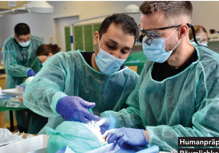
Humanpräparatekurs in den Räumlichkeiten der Anatomie der Charité, Berlin.