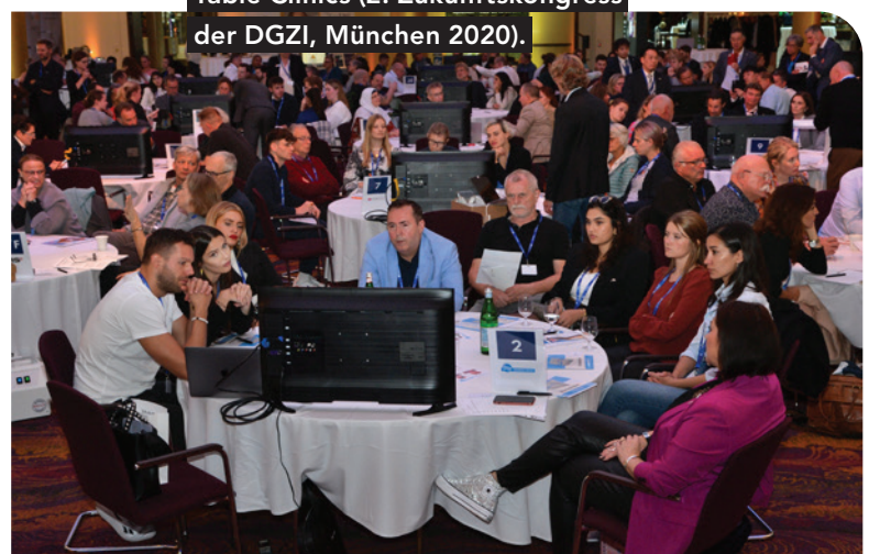
Tagungssaal mit gut besuchten Table Clinics (2. Zukunftskongress der DGZI, München 2020).