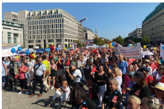
Wie letztes Jahr in Berlin gehen die bayerischen Zahnärzte und weitere Verbände nun am 12. Juni in München gegen die aktuelle Gesundheitspolitik der Bundesregierung auf die Straße.