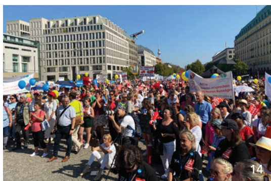
Wie letztes Jahr in Berlin gehen die bayerischen Zahnärzte und weitere Verbände nun am 12. Juni in München gegen die aktuelle Gesundheitspolitik der Bundesregierung auf die Straße.