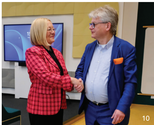
Durch konstruktive Verhandlungen mit allen großen Krankenkassen konnte die KZVB Budgetüberschreitungen für 2023 vermeiden.