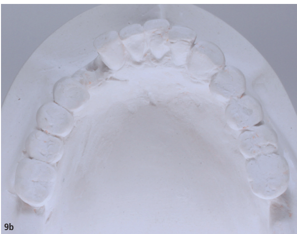
Abb. 8: Situationsmodell vor implantatchirurgischer und prothetischer Planung, Lücke 33 sowie fehlende Okklusionskontakte linksseitig. – Abb. 9a und b: Situationsmodelle vor chirurgischer Planung mit Lückensituation 14–12, 33.

Bei der Zahnersatzplanung älterer Patienten wird häufig die „Back-off“-Strategie angewandt, die zwar den aktuellen Behandlungsbedarf der Patienten deckt, aber auch zukünftige Schwierigkeiten und Hindernisse beleuchtet. Falls der Patient im letzten Lebensabschnitt motorisch oder kognitiv nicht mehr in der Lage ist, eine ausreichende Mundhygiene der osseointegrierten Implantate zu betreiben, sollten die Implantatsuprakonstruktionen ausbaufähig sein oder durch einfachere Konstruktionen ersetzt werden können. 11