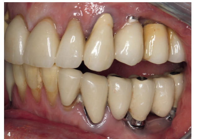
Abb. 2: Festsitzender implantatgestützter Zahnersatz bei einer älteren motorisch eingeschränkten Patientin. – Abb. 3: Klinische Ausgangssituation rechtsseitig, Wurzelreste 12, 14, schwierig zu reinigende plaquebelegte Suprakonstruktion mit freiliegenden Implantathälften und schwebendem Zwischengliedbereich. – Abb. 4: Implantatversorgtes Gebiss einer älteren Patientin mit freiliegenden Implantathälften, eingeschränkter Mundhygiene bei hohem Reinigungsbedarf.

zielles Risiko in der Implantatchirurgie und für die Überlebensrate der Implantate darstellen, da sie Osteoporose verursachen und somit den Knochenstoffwechsel negativ beeinflussen können. 11,14