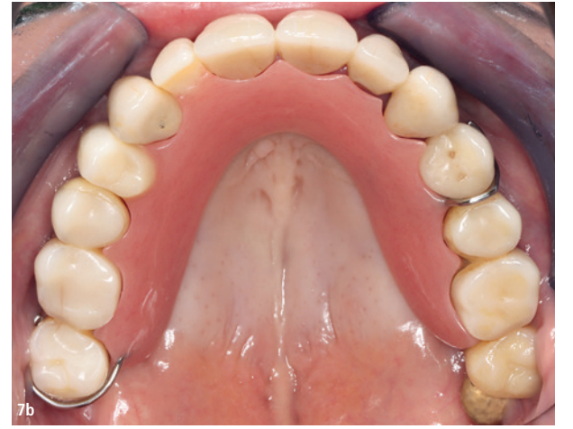
Abb. 6: Patientin nach Entfernung der Wurzelreste 12, 14 und verbesserter häuslicher Mundhygiene. – Abb. 7a und b: Verbesserte häusliche Mundhygiene und provisorischer herausnehmbarer Zahnersatz im Oberkiefer.

Zusammenfassend lässt sich festhalten, dass es keine absoluten Kontraindikationen für die Implantatrehabilitation bei systemisch beeinträchtigten Patienten gibt. Dennoch sollte zur Risikominimierung bei implantatgestützten Rehabilitationen zunehmendes Alter, rheumatologischer Zustand, kardiovaskulärer Zustand und Hepatitis aufgrund ihres negativen Einflusses auf das Ergebnis berücksichtigt werden, da es bis zu 40 Prozent höhere Ausfallraten geben kann. 18