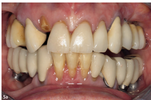
Abb. 5a und b: Klinische Ausgangssituation: feststehend implantatgestütztes Restgebiss mit freiliegenden plaquebelegten Implantathälsen, Wurzelresten 12, 14, abgesunkener Okklusionsebene mit offenem Biss linksseitig.

Im Rahmen einer umfassenden zahnmedizinischen Untersuchung vor möglicher Implantatversorgung werden häufig die kognitiven, funktionellen, körperlichen und geistigen Fähigkeiten sowie die sozioökonomischen Rahmenbedingungen erfasst. Individuell kann hierbei die Mundöffnung über längere Zeit, die Mobilität auf dem Behandlungsstuhl, Anpassungsschwierigkeiten an neuen Zahnersatz, Mundhygienefähigkeit sowie der Zugang zu Mundhygieneprodukten bewertet werden (Abb. 2).