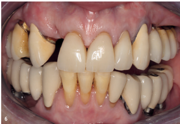
Abb. 6: Patientin nach Entfernung der Wurzelreste 12, 14 und verbesserter häuslicher Mundhygiene. – Abb. 7a und b: Verbesserte häusliche Mundhygiene und provisorischer herausnehmbarer Zahnersatz im Oberkiefer.