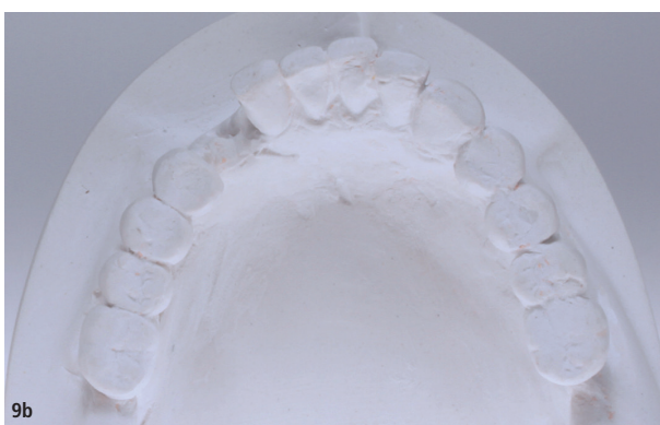
Abb. 8: Situationsmodell vor implantatchirurgischer und prothetischer Planung, Lücke 33 sowie fehlende Okklusionskontakte linksseitig. – Abb. 9a und b: Situationsmodelle vor chirurgischer Planung mit Lückensituation 14–12, 33.