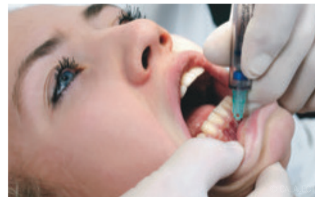
Abb. 3: Infiltrationsanästhesie.