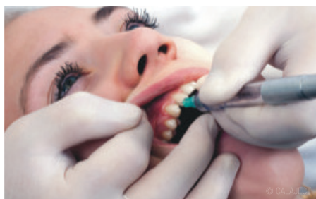
Abb. 1: Intraligamentäre Injektion.