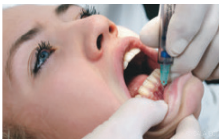
Abb. 3: Infiltrationsanästhesie.