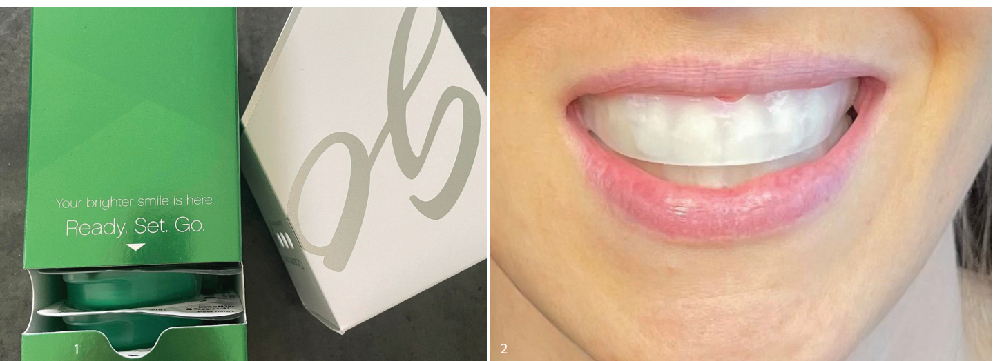
Abb. 1: Opalescence Go Whitening Kit mit zehn vorgefüllten UltraFit Trays. Abb. 2: Patientin mit eingesetzten UltraFit Trays.