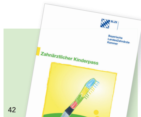
Der Zahnärztliche Kinderpass der BLZK ist als „Vorsorgeplan“ bei Zahnarztpraxen und Eltern gleichermaßen beliebt.