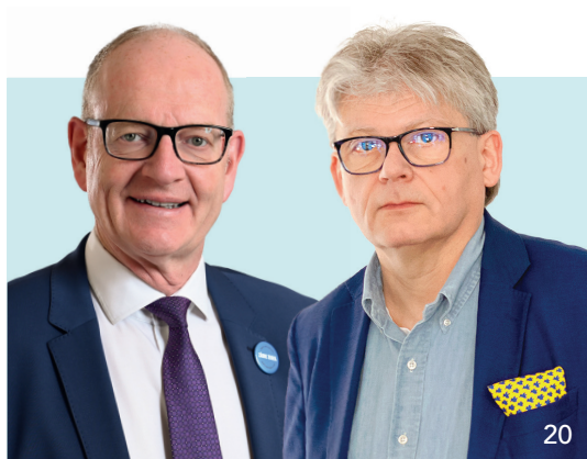
Budgetierung widerspricht der Selbstverwaltung – zum „Tag der Selbstverwaltung“ fordern KZBV und KZVB weniger staatlichen Einfluss auf das Gesundheitswesen.