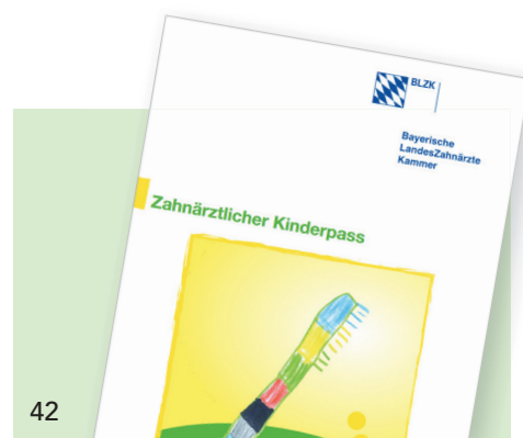
Der Zahnärztliche Kinderpass der BLZK ist als „Vorsorgeplan“ bei Zahnarztpraxen und Eltern gleichermaßen beliebt.