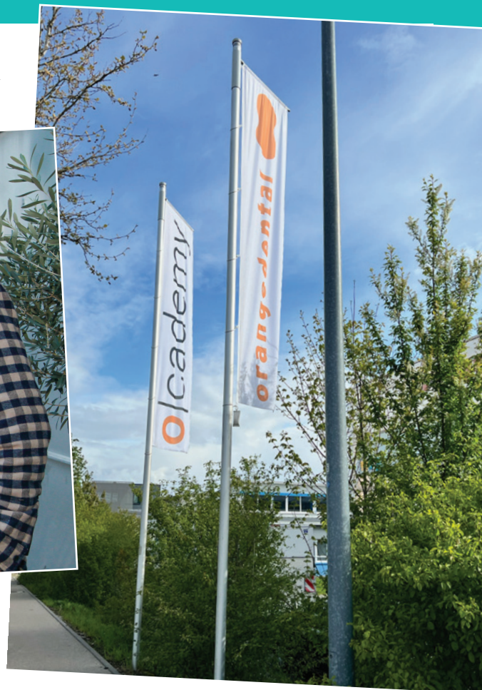
Das neue o|cademy Education Center öffnete im April in Biberach an der Riß seine Tore.