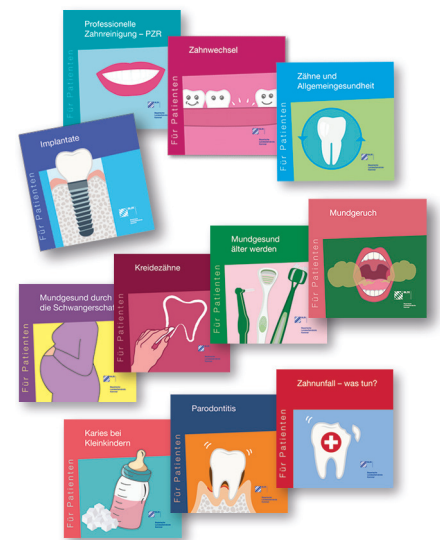
Alle elf Pockets können Zahnarztpraxen auch gesammelt im Paket bestellen.

Neben dem Pocket bietet die BLZK viele weitere Infomaterialien zum Thema Implantate an. So ist im Online-Shop derzeit noch die umfangreichere Broschüre „Implantate“ im Din A5-Format erhältlich. Sie wird jedoch nach Ende der aktuellen Auflage durch das Pocket im kompakteren Format ersetzt. Außerdem finden Sie im Online-Shop ein Infoblatt mit Tipps zu Zahnimplantaten, das Sie kostenlos herunterladen und für Ihre Patienten zum