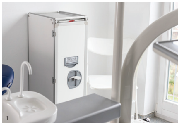
Abb. 1 und 2: Trolleys sind Stauraumwunder, wendig, leicht, lassen sich hervorragend säubern und sind eigentlich überall einsetzbar.