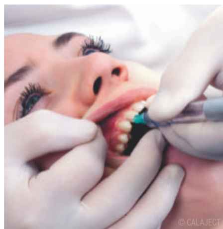
Abb. 1: Intraligamentäre Injektion.