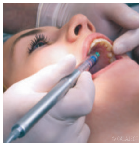
Abb. 2: Palatinale Injektion.