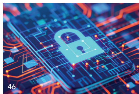
Schutz vor Hackern – KZVB führt Zwei-Faktor-Authentifizierung für den Zugang zu „Meine KZVB“ ein.