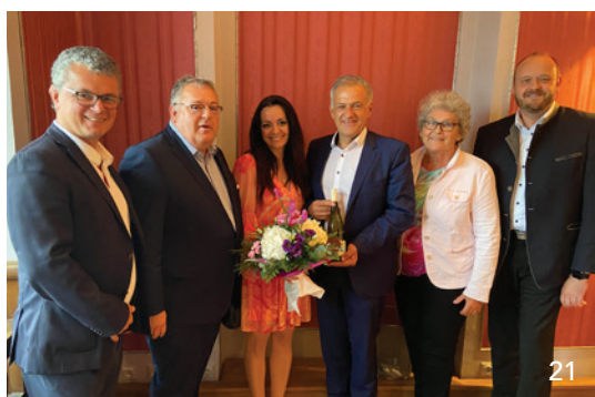
Im Rahmen seiner Klausurtagung diskutierte der Vorstand der BLZK mit Bürgermeistern und Landräten aus der Oberpfalz über Lösungsansätze gegen das drohende Praxissterben im ländlichen Raum.