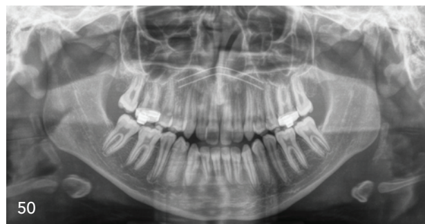
In diesem Beitrag erläutern die Autoren die Bedeutung von Differenzialdiagnose und -therapie bei transversalem Defekt im Oberkiefer.