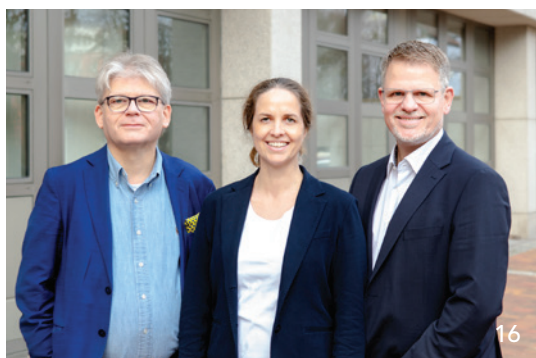
Im Interview mit dem BZB spricht der Vorstand der KZVB über die aktuelle Stimmung im Berufsstand und die Gründe, warum Bayern aktuell noch gut dasteht.