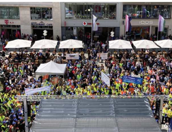
Kundgebung der BLZK in München: Über 1 000 Teilnehmer forderten faire Bedingungen für Zahnarztpraxen und Praxisteam.