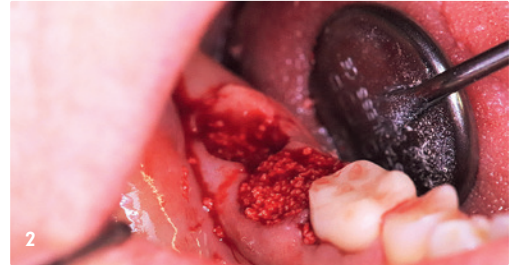
2 Socket Preservation Regio 47/48 mit DentOss®.