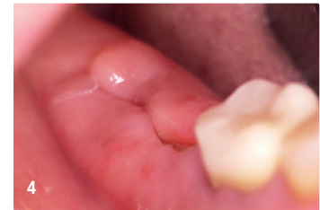
4 Wundheilung nach acht Tagen.