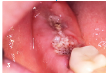
3 Wundheilung nach zwei Tagen.