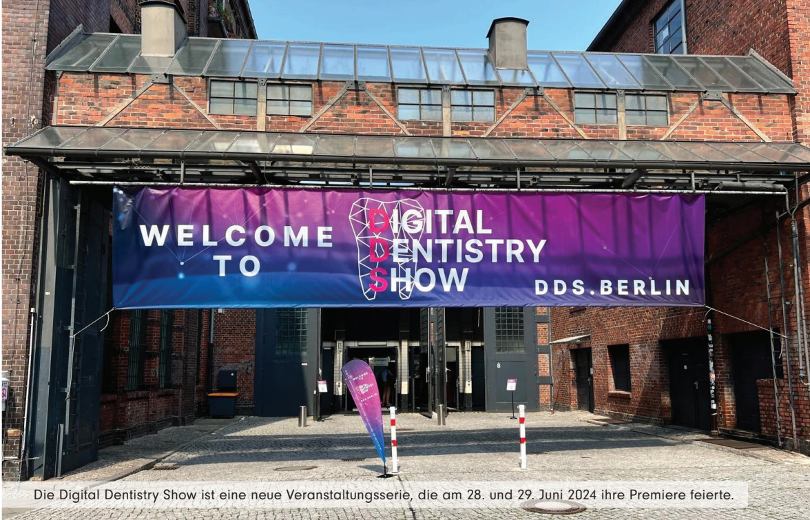
Die Digital Dentistry Show ist eine neue Veranstaltungsreihe, die am 28. und 29. Juni 2024 ihre Premiere feierte.