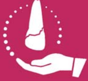
Rette Deinen Zahn

Deutsche Gesellschaft für Endodontologie und zahnärztliche Traumatologie e.V.