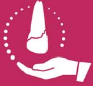
Rette Deinen Zahn

Deutsche Gesellschaft für Endodontologie und zahnärztliche Traumatologie e.V.