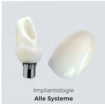
Implantologie Alle Systeme