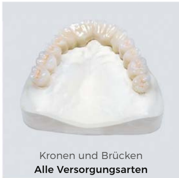
Kronen und Brücken Alle Versorgungsarten