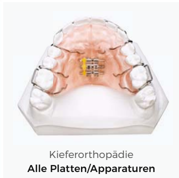
Kieferorthopädie Alle Platten/Apparaturen