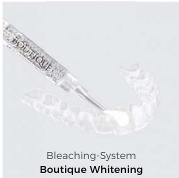
Bleaching-System Boutique Whitening