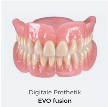
Digitale Prothetik EVO fusion