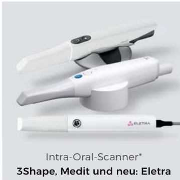
Intra-Oral-Scanner* 3Shape, Medit und neu: Eletra

*Permadental verarbeitet die Daten sämtlicher gängiger Scanner-Systeme.