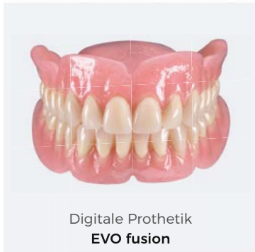
Digitale Prothetik EVO fusion