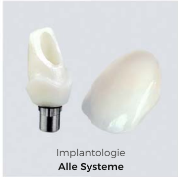
Implantologie Alle Systeme