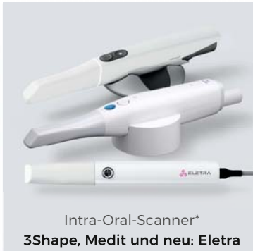
Intra-Oral-Scanner* 3Shape, Medit und neu: Eletra

*Permadental verarbeitet die Daten sämtlicher gängiger Scanner-Systeme.