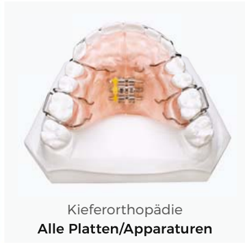
Kieferorthopädie Alle Platten/Apparaturen