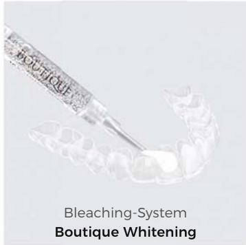
Bleaching-System Boutique Whitening