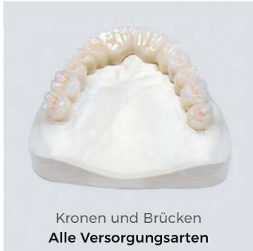
Kronen und Brücken Alle Versorgungsarten