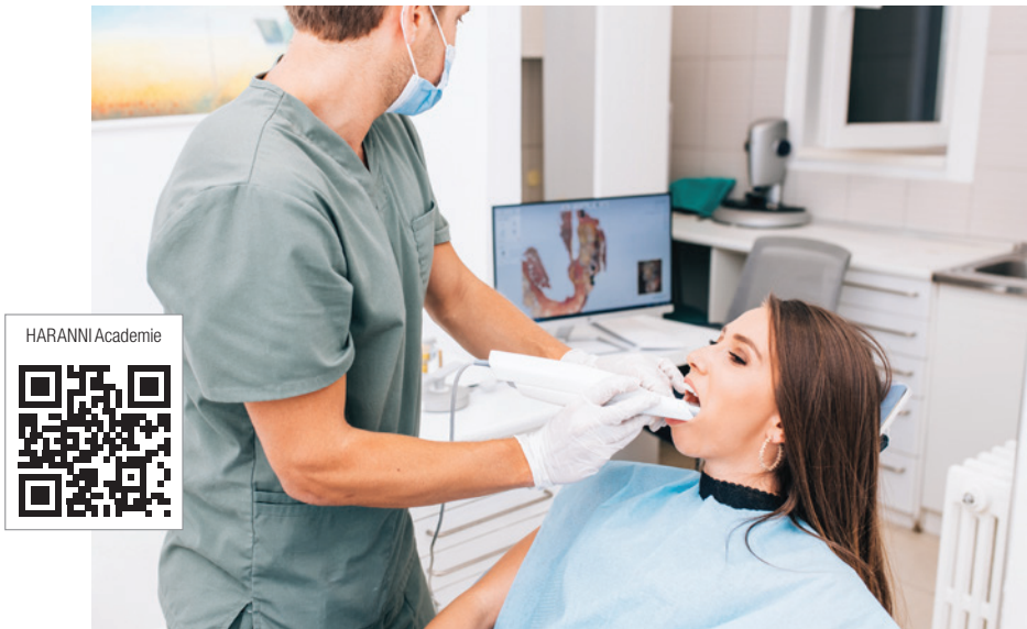
Abb. 1: Digitale Abformung

Im Kompakt-Curriculum CAD/CAM-Zahnmedizin und Kompakt-Curriculum CMD der HARANNI Academie erfahren Sie, wie Sie digitale Zahnmedizin kompetent in Ihrer Praxis einsetzen.