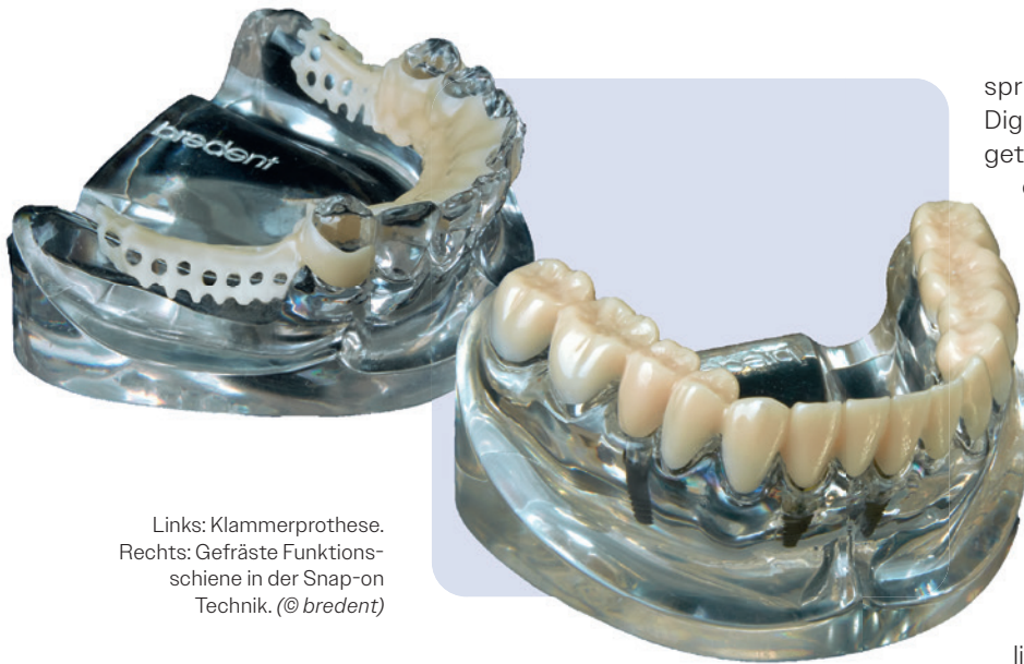
Links: Klammerprothese. Rechts: Gefräste Funktionsschiene in der Snap-on Technik.