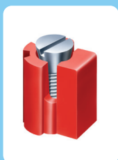
Höhe 2,9 mm Breite 2,7 mm

kein Bohren, kein Kleben, einfach nur schrauben 100.000 fach verarbeitet