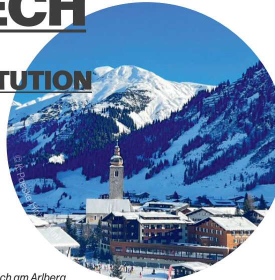
Abb. 1: Lech am Arlberg.