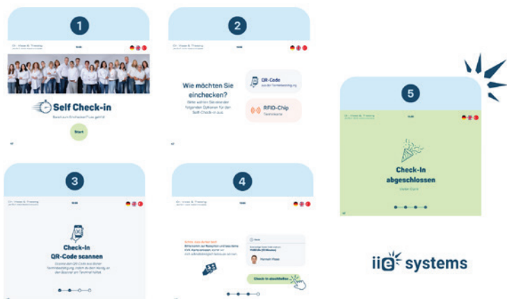
Abb. 5: Gern stellen wir Ihnen unsere neueste Entwicklung auf der DGKFO in Freiburg im Breisgau vor und zeigen Ihnen, wie Sie Ihre Praxis revolutionieren können. Das Team von iie-systems freut sich auf Ihren Besuch.

Mit der fortschrittlichen Technologie von iie-systems heben Sie Ihre Praxis auf ein neues Level, modernisieren Ihre Arbeitsabläufe und schaffen Begeisterung auf allen Seiten. Patienten freuen sich über eine stressfreie und schnelle Anmeldung. Mitarbeiterinnen werden entlastet und können sich auf andere Arbeiten sowie auf die persönliche Betreuung konzentrieren. Einfacher und effizienter geht es nicht.