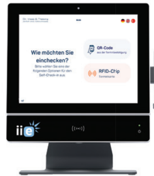
Abb. 3: Der gesamte Prozess ist intuitiv und leicht verständlich. Alles ist bequem vom Handy aus zu bedienen. Die Schnittstelle ivoris connect zur Praxisverwaltungssoftware sorgt für einen nahtlosen Datenfluss, bei dem alle Informationen umgehend verfügbar sind. Der Ablauf gestaltet sich deutlich effizienter, die Ressourcen der Praxis werden optimal genutzt und der Praxisalltag wird revolutioniert.