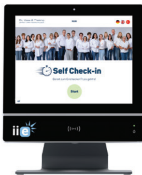
Abb. 1: Mit der automatischen Terminerinnerung über iie-systems erhalten Patienten einen QR-Code für den digitalen Check-in.

Die Mitarbeiterinnen am Empfang können sich auf andere wichtige Aufgaben wie z.B. Telefonannahme konzentrieren.