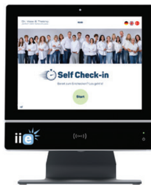
Abb. 1: Mit der automatischen Terminerinnerung über iie-systems erhalten Patienten einen QR-Code für den digitalen Check-in.

Die Mitarbeiterinnen am Empfang können sich auf andere wichtige Aufgaben wie z.B. Telefonannahme konzentrieren.