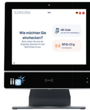
Abb. 3: Der gesamte Prozess ist intuitiv und leicht verständlich. Alles ist bequem vom Handy aus zu bedienen. Die Schnittstelle ivoris connect zur Praxisverwaltungssoftware sorgt für einen nahtlosen Datenfluss, bei dem alle Informationen umgehend verfügbar sind. Der Ablauf gestaltet sich deutlich effizienter, die Ressourcen der Praxis werden optimal genutzt und der Praxisalltag wird revolutioniert.