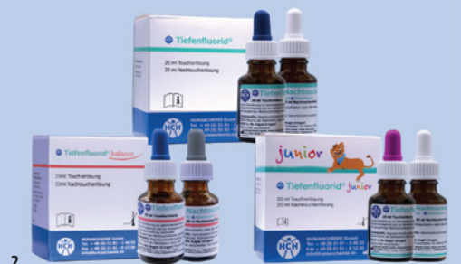
Abb. 1: Behandlungsphasen. – Abb. 2: Tiefenfluorid.

Die Anwendung von Tiefenfluorid beziehungsweise Tiefenfluorid junior in der Praxis ist einfach. Tiefenfluorid ist frei von Lösungsmitteln und Alko-