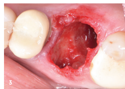
Abb. 1: Alveole mit innen liegendem Weichgewebe. – Abb. 2: Degranulationsbohrer entfernen entzündetes Weichgewebe sicher und schnell. – Abb. 3: Freiliegende Knochenwände erlauben ideale Knochenbildung.