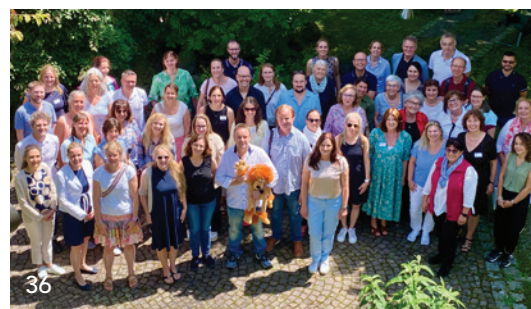
Bei der Tagung der Arbeitskreisvorsitzenden in München wurde das Pilotprojekt „Charly“ der LAGZ Bayern vorgestellt.