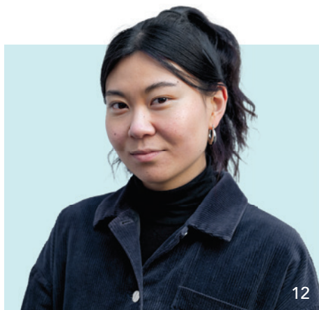
In ihrem Kommentar kritisiert Aurora Li die Rolle von Finanzinvestoren im Gesundheitssystem, denen es primär um den eigenen Profit geht.