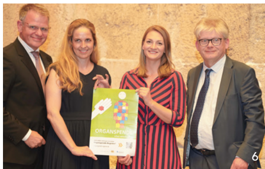
Im Interview mit dem BZB erklärt die bayerische Gesundheitsministerin Judith Gerlach, weshalb sie beim Thema Organspende für eine gesetzliche Neuregelung ist.