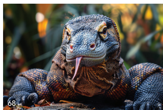
Wissenschaftler des Londoner King's College entdeckten an den Zähnen von Komodowaranen eine hauchdünne Eisenbeschichtung.

Die Herausgeber sind nicht für den Inhalt von Beilagen verantwortlich.