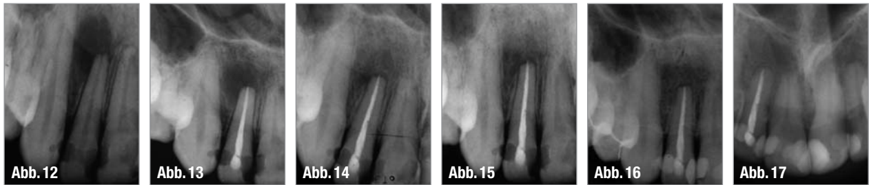
▲ Abb. 13: Kontrollaufnahme 1999 – die Wurzelkanalfüllung erfolgte mithilfe thermoplastifizierter Guttapercha in vertikaler Kondensationstechnik. ▲ Abb. 14: Kontrollaufnahme 2000 – die apikale Läsion zeigt eine deutliche Verkleinerung – die Heilungsdynamik der Läsion ist erkennbar, auch wenn apikal ein leicht verbreiteter PA-Spalt erkennbar ist. ▲ Abb. 15: Kontrollaufnahme 2003 – die apikale Läsion ist komplett verschwunden, der PA-Spalt erscheint apikal noch leicht erweitert. ▲ Abb. 16: Kontrolle 2006 – klinisch unauffälliger Zahn 12, röntgenologisch leicht verbreiteter apikaler PA-Spalt. ▲ Abb. 17: Kontrollaufnahme 2010 – 11 Jahre post OP – stabile apikale Verhältnisse apikal normal erscheinende Strukturen, PA-Spalt unauffällig, apikale Läsion komplett ausgeheilt.