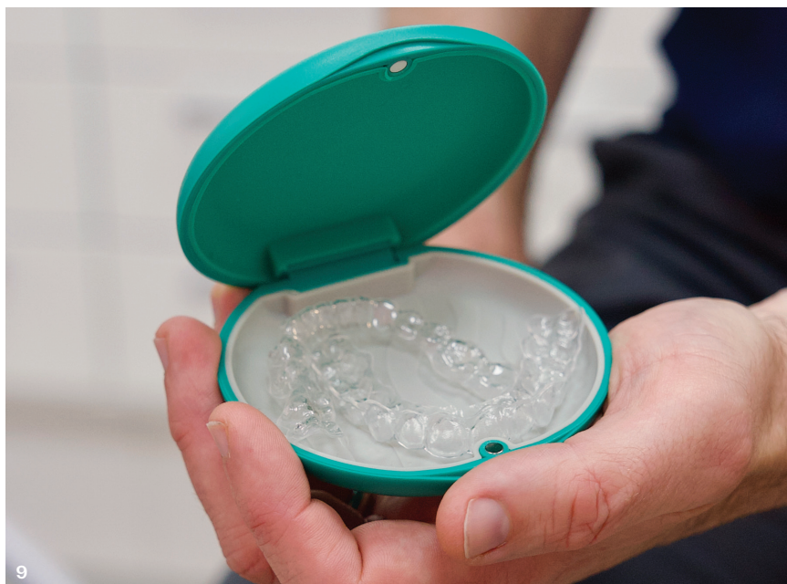
Abb. 9: Der neue MOV'ALIGNERS von GC Orthodontics.

Ebenfalls neu im Repertoire von dentalline ist das passiv selbstligierende MIM-Metallbracket PT K , welches in drei verschiedenen Torquestufen erhältlich ist. Mit seiner reduzierten Größe und stark abgerundeten Kanten bietet das PT K Bracket nicht nur einen herausragenden Tragekomfort, sondern auch eine ästhetisch ansprechende Optik. Dank des passiv selbstligierenden Verschlussmechanismus kann der Bogen frei im Slot gleiten, was die Reibung minimiert und eine sanfte, gleichmä-