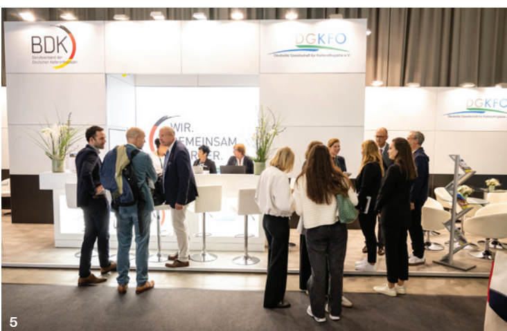
Abb. 3: Am Stand von Forestadent. Abb. 4: Auch in diesem Jahr zeichnete die DGKFO wieder eine Vielzahl hervorragender Wissenschaftlerinnen und Wissenschaftler aus. Das Foto zeigt die diesjährigen Gewinnerinnen und Gewinner. Abb. 5: Zum ersten Mal mit gemeinsamem entworfenem Logo – der gemeinsame Stand vom BDK und DGKFO.

Ein weiterer wichtiger Teil der Jahrestagung ist die Fachmesse. Wie in jedem Jahr stellten zahlreiche Aussteller die neuesten Innovationen aus der KFO-Welt vor. Für FORESTADENT aus Pforzheim war die Messe in der Schwarzwaldhauptstadt quasi ein Heimspiel. In traditionsgemäßer Tracht präsentierte sich das Team am Stand und lud die Gäste zur köstlichen Schwarzwälder Kirschtorte ein. Dabei stellte das Unternehmen zwei beeindruckende Neuheiten vor. Zum einen konnten sich die Teilnehmenden über die Erweiterung des OrthoEasy® Portfolios informieren, welches auf insgesamt 16 Varianten vergrößert wurde. Das System bietet jetzt noch facetten-