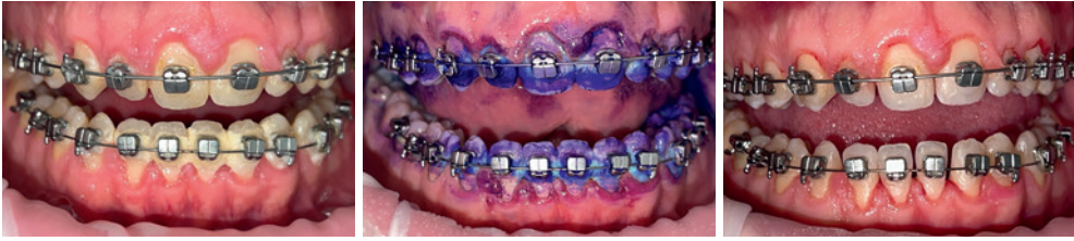
Vor der GBT.

Auf der diesjährigen Tagung der DGKFO in Freiburg im Breisgau präsentierte das Team von EMS das evidenzbasierte Guided Biofilm Therapy (GBT) Protokoll.