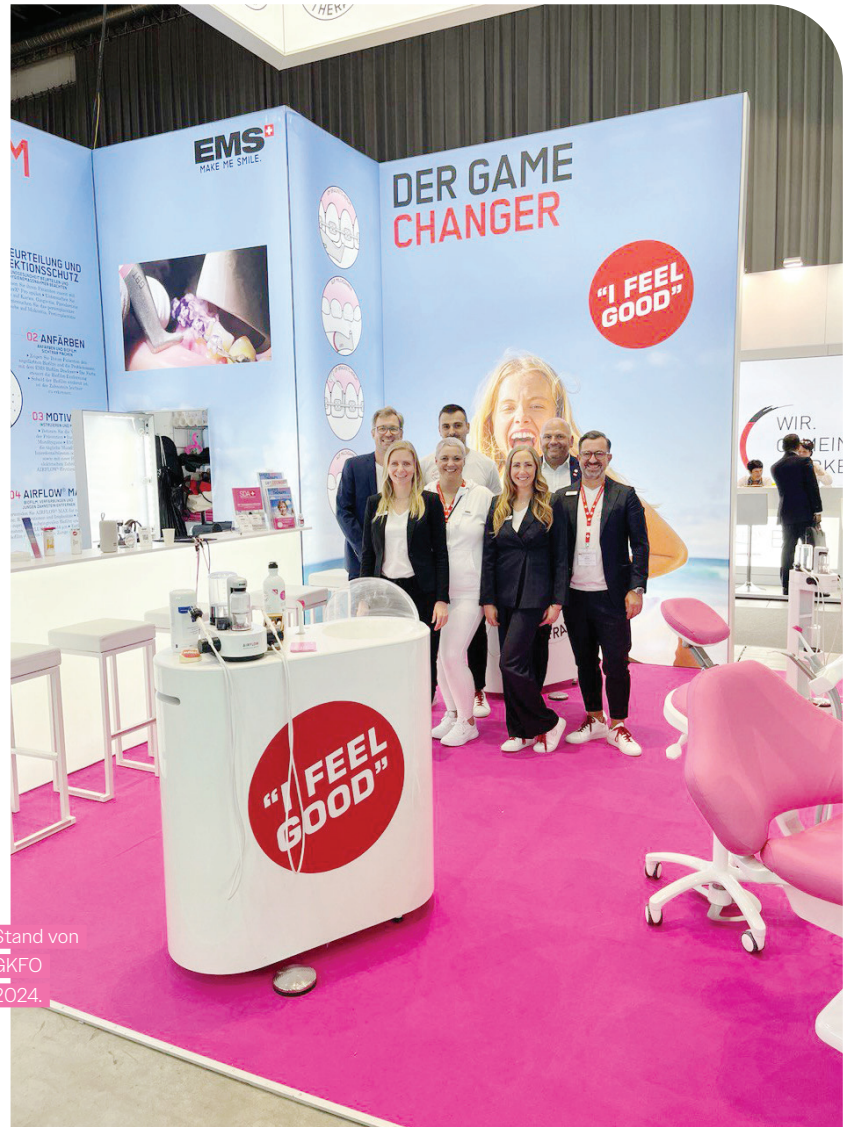
Teamwork am Stand von EMS auf der DGKFO Jahrestagung 2024.