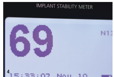
Abb. 1: Initiale Alveole nach Entfernung des Molars. – Abb. 2: Echte Knochenbasis nach EthOss Regeneration in vier Monaten. – Abb. 3 und 4: Implantatinserterion mit exzellenten Werten.