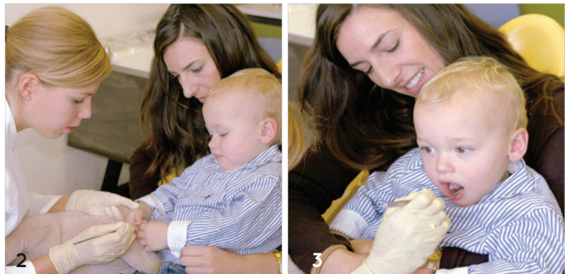
Abb. 2: 2,5-jähriges Kind beim ersten Zahnarztbesuch. Mittels „Tell-Show-Do“ kann die zahnärztliche Situation kindgerecht ohne akuten Behandlungsbedarf erläutert werden. Abb. 3: Zahnärztliche eingehende Untersuchung bei demselben Kind nach kindgerechter Erläuterung der durchzuführenden Maßnahmen.

Eine frühzeitige zahnmedizinische Prävention in Kombination mit einer optimierten häuslichen Mundhygiene kann die Entstehung von Karies verhindern. Eine frühzeitige Prävention setzt ebenso eine frühe Erkennung von Kariesrisikopatienten voraus. So hat der Gemeinsame Bundesausschuss (G-BA) dieses wichtige Konzept zur zahnmedizinischen Prävention bei Kleinkindern ab 2019 umgesetzt. Die neuen zahnärztlichen Untersuchungen ab dem ersten Milchzahn bzw. ab dem sechsten Lebensmonat (FU 1a, FU 1b, FU 1c)