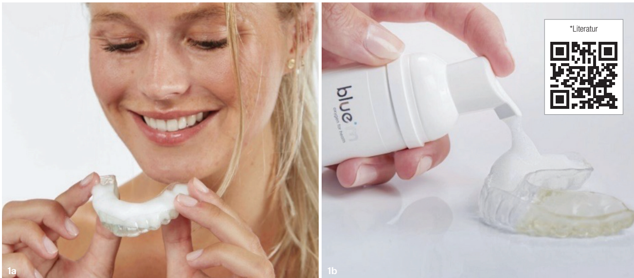
Abb. 1a und b: Der neue blue®m oral foam für Aligner, Retainer & KFO-Apparaturen – einfach in der Anwendung, sorgt er zu Hause und unterwegs für eine mundgesunde Reinigung und Pflege.

blue®m oral foam für Aligner, Retainer & KFO-Apparaturen.