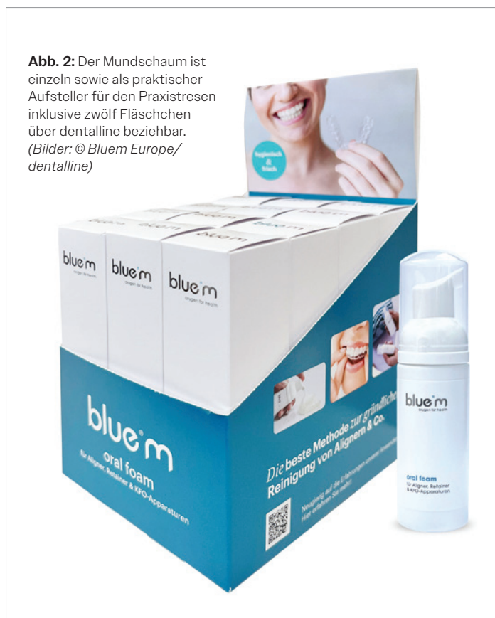
Abb. 2: Der Mundschäum ist einzeln sowie als praktischer Aufsteller für den Praxistresen inklusive zwölf Fläschchen über dentalline beziehbar.

Ob zu Hause oder unterwegs – die Anwendung des DE/AT-exklusiv über dentalline erhältlichen blue®m oral foam für Aligner, Retainer & KFO-Apparaturen ist denkbar einfach. Zu Hause wird dieser nach erfolgter Mundhygiene in und auf den Aligner gesprüht und mittels Finger oder weicher Zahnbürste gründlich verteilt. Nach kurzer Einwirkzeit kann der Aligner samt Schaum wieder eingesetzt werden. Überschüsse ausspucken, fertig. Ein Spülen ist nicht erforderlich. Ist der Aligner stark verschmutzt oder vergilbt, wird eine längere Einwirkzeit (ca. 5 Min.) empfohlen. Zudem sollte der Schaum abgebürstet und die Schiene unter klarem Wasser abgespült werden, bevor sie wieder eingesetzt wird.