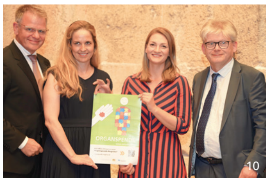
Neue Kultur der Organspende – das Bündnis Organspende verabschiedet Resolution, die eine Neuregelung der Organspende zum Ziel hat.