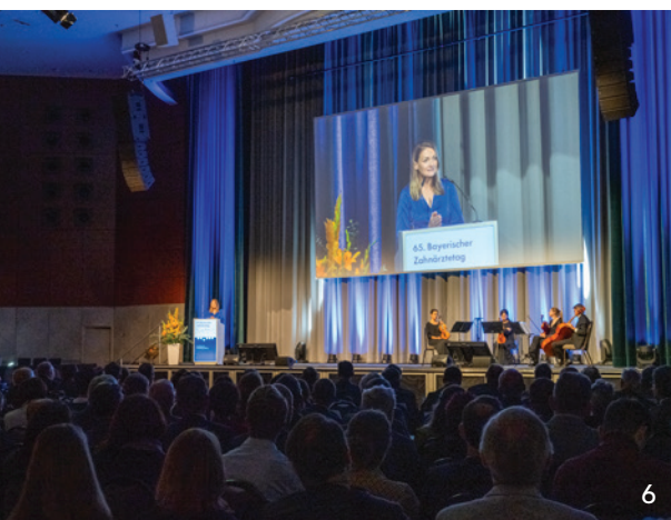
Bayerns Gesundheitsministerin Judith Gerlach feierte ihre Premiere beim Festakt des 65. Bayerischen Zahnärztetages in München.