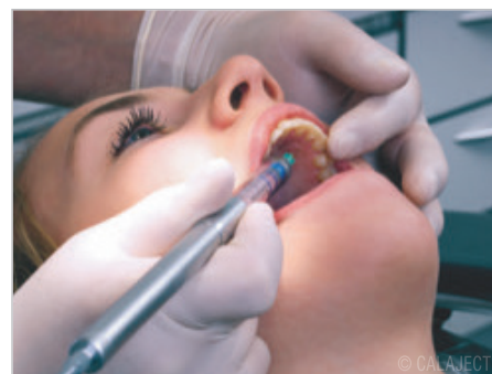
Abb. 2: Palatinale Injektion.