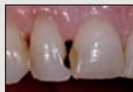
Vor der Behandlung: Insuffiziente Silikatfüllungen und abgestumpfte Papille (»schwarzes Dreieck«).