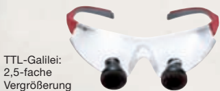
TTL-Galilei: 2,5-fache Vergrößerung