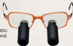
TTL-Prismatic: 3,5-fache und 4,5-fache Vergrößerung