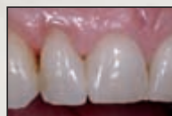
6 Wochen nach der Behandlung: sehr gute Papillenreaktion auf die restaurative Behandlung.