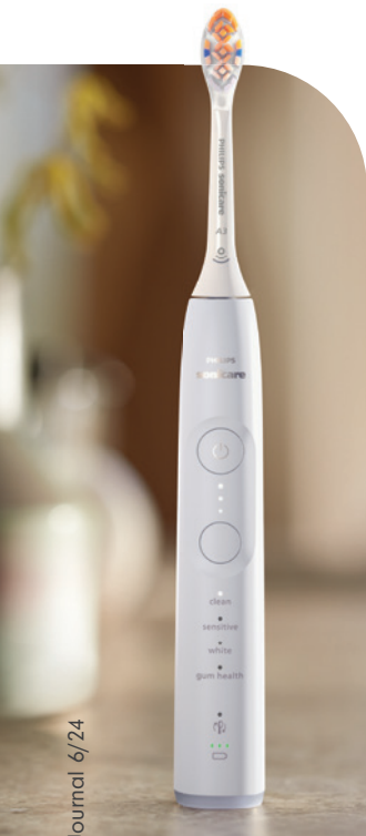
Prophylaxe Journal 6/24

Philips Sonicare ist die weltweit am häufigsten empfohlene Schallzahnbürstenmarke, sie war mit verschiedenen Modellen bereits Sieger bei Stiftung Warentest (z. B. 2021 und 2022) und kann ihre positive Wirkung auf die Mundhygiene durch evidenzbasierte Forschung unterstützen. 1