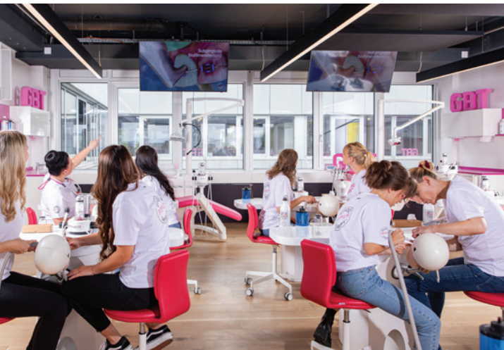
Das SDA-Trainingszentrum in München.

* Die Beiträge in dieser Rubrik stammen von den Anbietern und spiegeln nicht die Meinung der Redaktion wider.