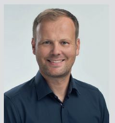
André Kranzusch Orthodontic Software Consulting