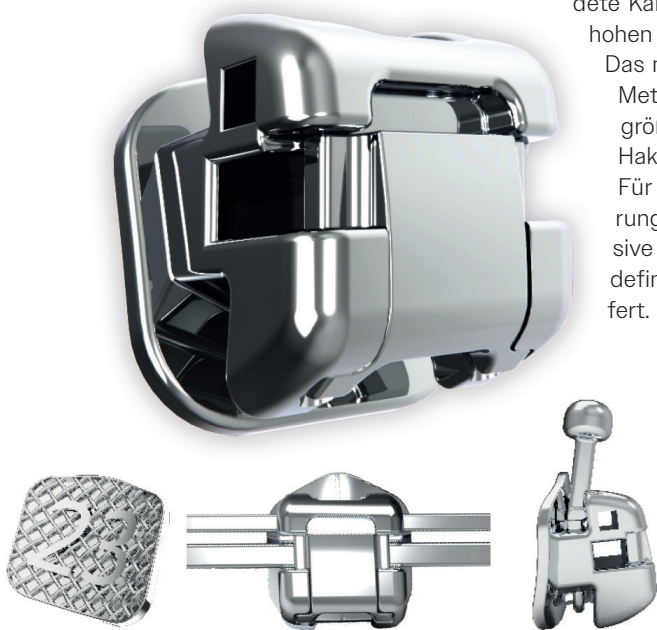
Abb. 1: Vielseitig, zuverlässig und angenehm zu tragen – das neue passiv selbstligierende PT K Metallbracket gibt es ab sofort bei dentalline.

dentalline GmbH & Co. KG info@dentalline.de www.dentalline.de