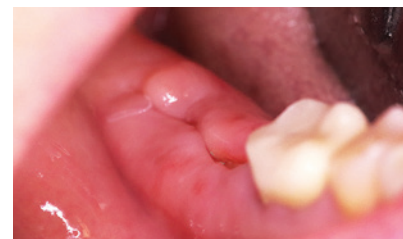
Wundheilung nach acht Tagen.