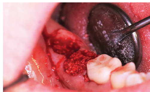
Socket Preservation Regio 47/48 mit DentOss®.