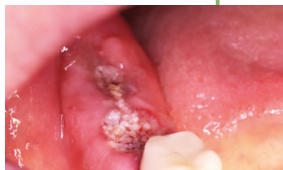
Wundheilung nach zwei Tagen.