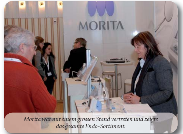
Morita war mit einem grossen Stand vertreten und zeigte das gesamte Endo-Sortiment.