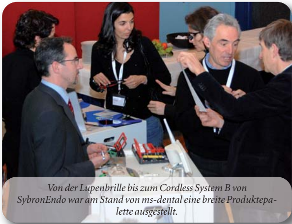
Von der Lupenbrille bis zum Cordless System B von SybronEndo war am Stand von ms-dental eine breite Produktpalette ausgestellt.