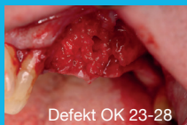
Defekt OK 23-28