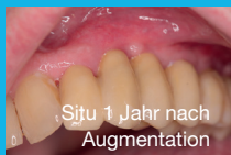
Situ 1 Jahr nach Augmentation