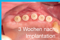
3 Wochen nach Implantation