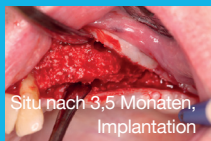
Situ nach 3,5 Monaten, Implantation