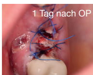
1 Tag nach OP