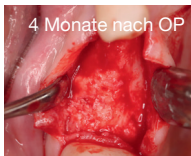
4 Monate nach OP