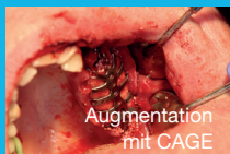
Augmentation mit CAGE