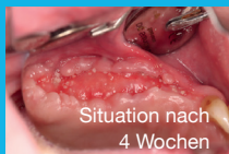
Situation nach 4 Wochen