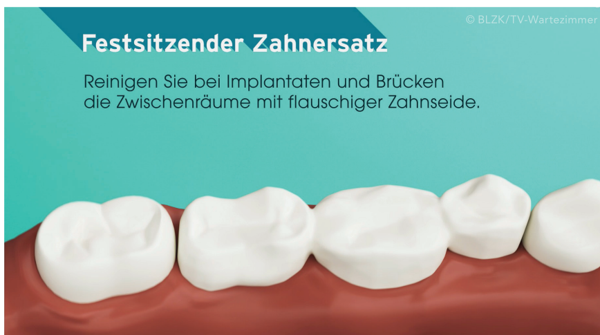
Der Film „Pflegetipps für Zahnersatz“ zeigt, warum gründliche Hygiene bei Implantaten so wichtig ist, und erklärt, wie sie richtig geht.