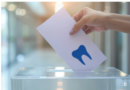
Welche Konsequenzen hat der Ausgang der Bundestagswahl 2025 für die Zahnärzteschaft? Die BLZK hat die Wahlprogramme der Bundestagsparteien dahingehend durchleuchtet.