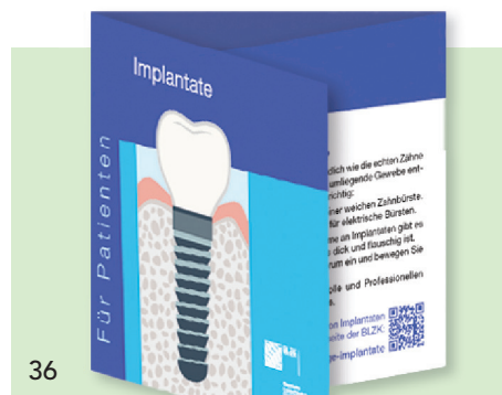
Im neuen Pocket „Implantate“ finden Patienten wichtige Informationen zum Thema.