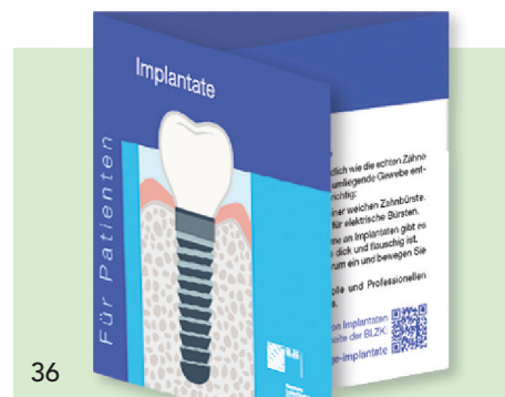
Im neuen Pocket „Implantate“ finden Patienten wichtige Informationen zum Thema.