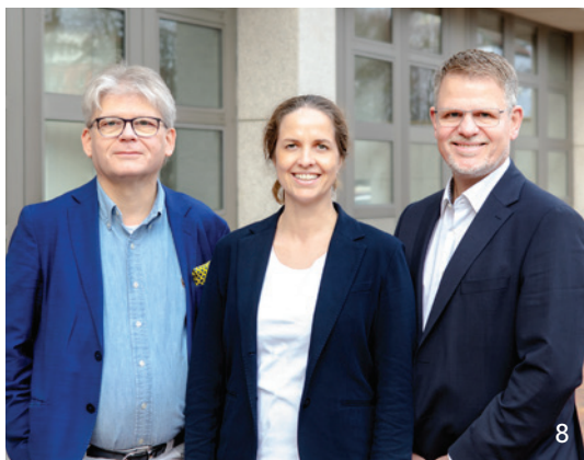
Im Interview erläutert der KZVB-Vorstand, was sich nach der Bundestagswahl in der Gesundheitspolitik ändern muss.