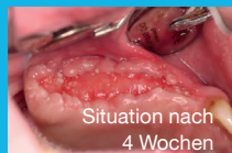
Situation nach 4 Wochen