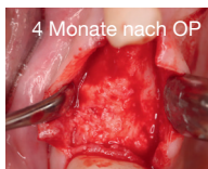
4 Monate nach OP