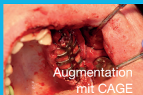
Augmentation mit CAGE