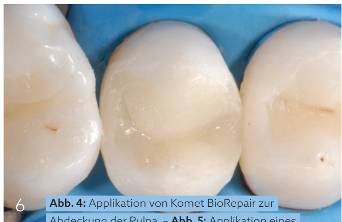
Abb. 4: Applikation von Komet BioRepair zur Abdeckung der Pulpa. – Abb. 5: Applikation eines Glasionomerzementes. – Abb. 6: Finale Kompositrestauration.

Teil 2 der Serie wird die erweiterten Möglichkeiten von Komet BioRepair für den Endo-Spezialisten darstellen, Teil 3 für den Chirurgen.