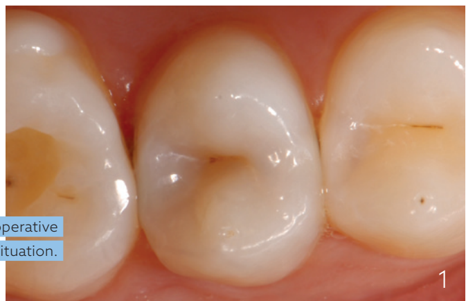
Abb. 1: Präoperative Ausgangssituation.

Nach lokaler Anästhesie erfolgte eine absolute Isolierung mit Kofferdam. Dadurch wird neben einer verbesserten Übersicht ein maximal keimreduziertes Arbeiten im Bereich der exponierten Pulpa ermöglicht. Dies ist ein entscheidender Schritt für deren langfristige Vitalerhaltung.