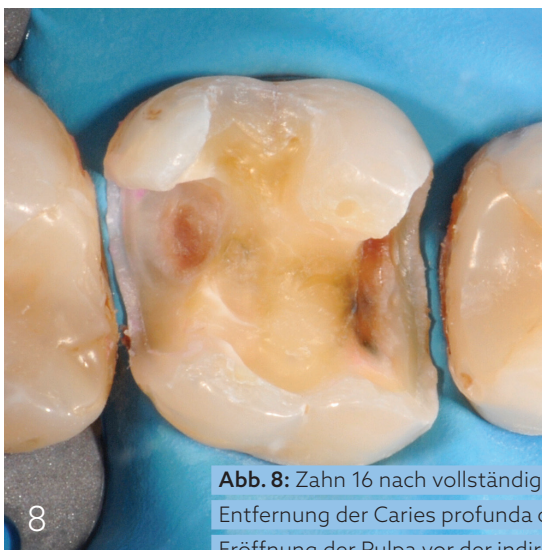
Abb. 8: Zahn 16 nach vollständiger Entfernung der Caries profunda ohne Eröffnung der Pulpa vor der indirekten Überkappung.

Auch im Fall einer Caries profunda ohne Pulpaexposition ist es sinnvoll, Maßnahmen zum Pulpaschutz in Form einer indirekten Überkappung zu treffen. Diese 31-jährige Patientin stellte sich mit einer insuffizienten Kompositfüllung mit Sekundärkaries an dem verstärkt kälteempfindlichen Zahn 16 vor. Nach Entfernung der Restauration und des kariösen Gewebes erforderte die voraussichtliche Nähe zur Pulpa (Abb. 8) einen geeigneten Pulpaschutz mit einem biokompatiblen Material, das gut auf dem Dentin anwendbar ist. Komet BioRepair wurde großzügig aufgetragen, denn trotz der Anwendung für diese Indikation, bei der das Material deutlich koronal der Schmelz-Zement-Grenze eingesetzt wird, sind keine ästhetischen Einschränkungen wie Verfärbungen zu erwarten. Somit konnte der Zahn in derselben Sitzung mit einer ästhetischen Kompositrestauration versorgt werden.