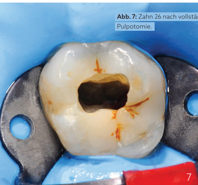
Abb. 7: Zahn 26 nach vollständiger Pulpotomie.

Eine 37-jährige Patientin stellte sich mit einer stark ausgeprägten Sensibilität auf Temperaturreize und zuletzt verstärkt auftretenden spontanen Schmerzen an Zahn 26 vor. Schließlich wurde eine vollständige Pulpotomie durchgeführt (Abb. 7). Die Zugangskavität wurde mit dem EndoGuard (H269QGK.314.012) präpariert, da dieser eine nicht schneidende Spitze hat, sodass gezielt und sicher Überhänge und darunter liegendes Pulpagewebe entfernt werden können. Nach Hämostase wurden die vitalen Pulpastümpfe und Kanäleingänge mit Komet BioRepair abgedeckt. Der Zahn wurde in derselben Sitzung endgültig mit einer Kompositrestauration versorgt. Die einzelnen Schritte entsprachen weitestgehend denen des ersten Falls. Seitdem zeigt sich der Zahn symptomlos.