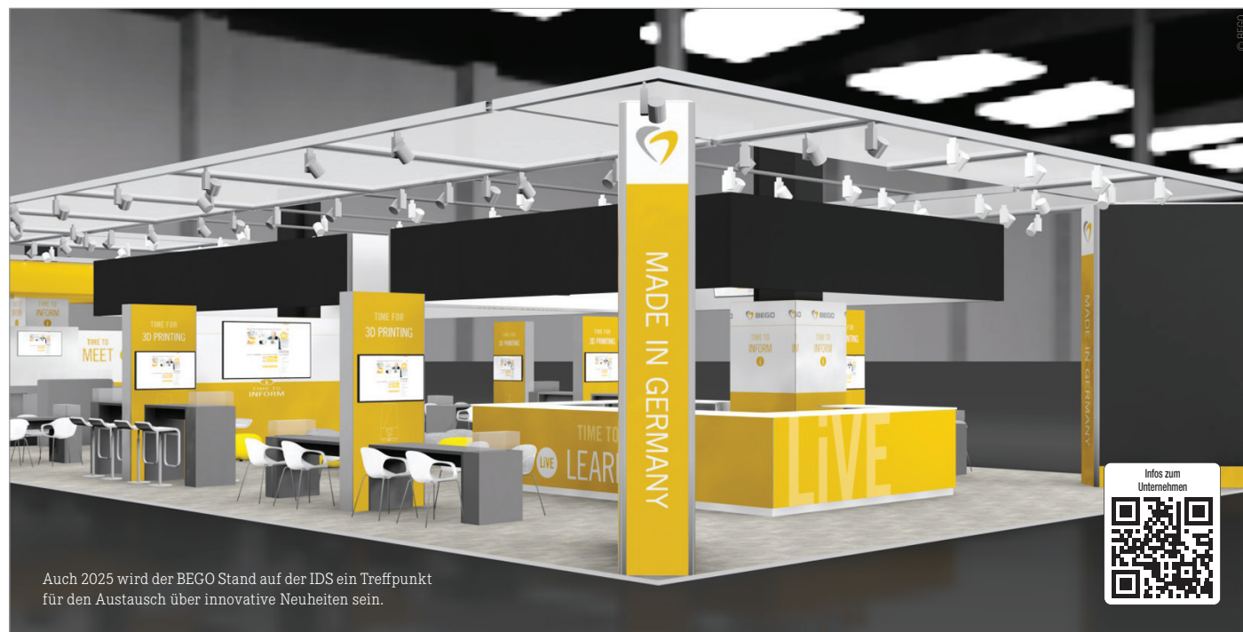
Auch 2025 wird der BEGO Stand auf der IDS ein Treffpunkt für den Austausch über innovative Neuheiten sein.

Im Bereich Implantologie stellt das Dentalunternehmen erstmals Semados® Esthetic Line