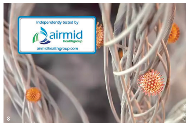
Abb. 7: Der Sensor scannt die Luft 1'000 Mal pro Sekunde. – Abb. 8: Bis zu 0,003 Mikrometer kleine Mikropartikel im Filter.