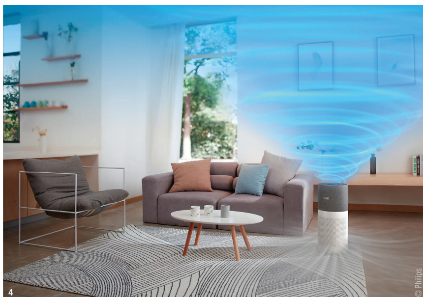
Abb. 4: Schema der Luftzirkulation im Raum am Beispiel des 4000i-Systems. – Abb. 5: Schema der Luftzirkulation. – Abb. 6: Aufbau des dreilagigen Filtersystems.

Das Luftreinigungssystem im Wartezimmer ist optisch repräsentativ und saugtechnisch strategisch optimal aufgestellt und saugt