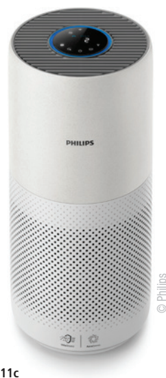
Abb. 11a–c: 4000i: das leistungsstärkste System (a). 2000i: Luftreinigungs- und Befeuchtungssystem (b). 1000i: das kompakteste System (c).