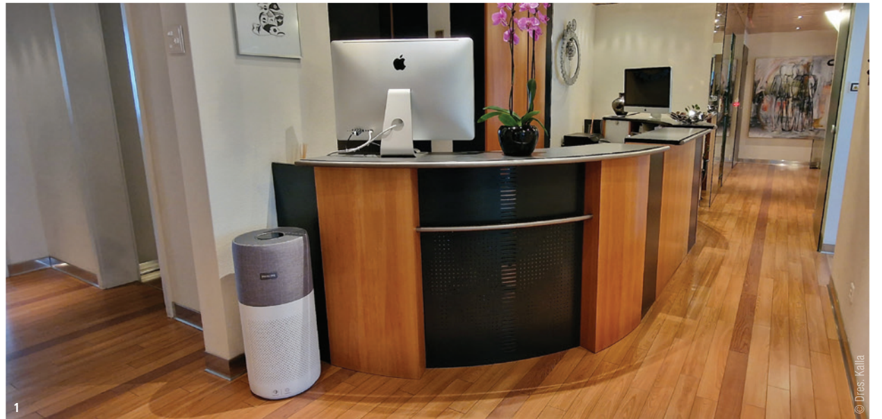
Abb. 1: Zentral positioniertes Luftreinigungssystem 4000i in unserer Zahnarztpraxis mit einer Gesamtgrundfläche von 200 Quadratmetern.

Wir setzen in unserer Praxis das Grösste der aktuell verfügbaren Systeme, das 4000i, zentral im Empfangsbereich ein, im Wartezimmer eines aus der 2000i-Serie, welches zusätzlich zur Luftfilterung auch noch die Luftbefeuchtung optimiert und einen angenehmen kühlenden Effekt des Wartebereichs im Sommer erzielt und in allen vier Behandlungszimmern zusätzlich je eines der kleineren 1000i-Systeme. Die Geräte aus der 1000i-Serie sind aktuell das kleinste System mit einem dreilagigen Filtersystem und automati-