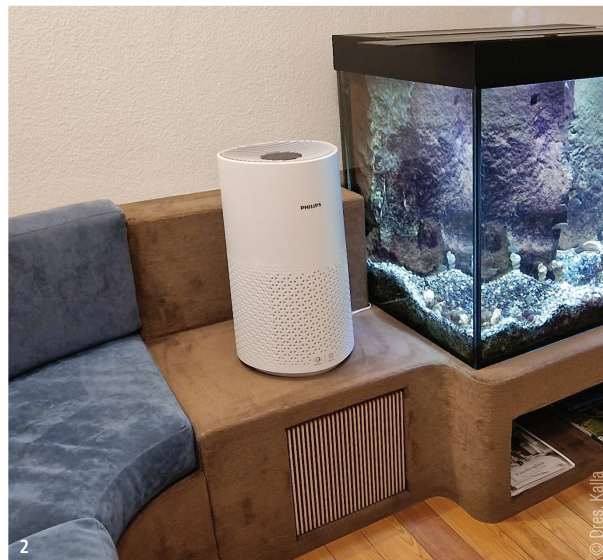
Abb. 2: Das System 1000i im Wartezimmer. – Abb. 3: Das System 2000i mit Luftbefeuchtung im Wartezimmer.