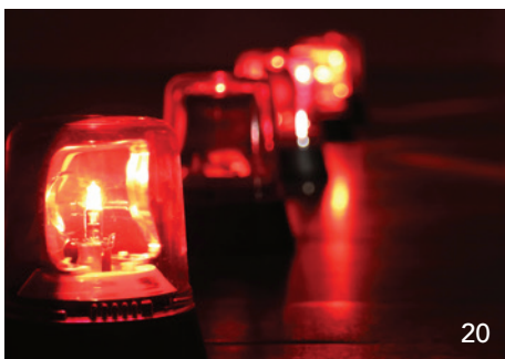
Eine repräsentative Studie des Bundesverbandes der Freien Berufe (BFB) bestätigt den akuten Fachkräftemangel – über 200 000 Stellen können aktuell nicht besetzt werden.