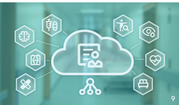
Offener Brief ans BMG – Die KVen der Modellregionen fordern die Verschiebung des Einführungstermines der ePA.