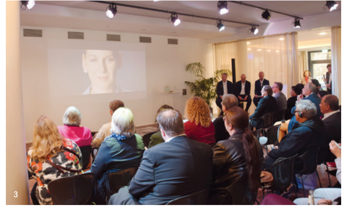
• 1: Die IDS-Auftaktveranstaltung im KölnSKY bot einen spektakulären Ausblick über die Rheinmetropole. • The IDS opening event at KölnSKY offered a spectacular view of the Rhine metropolis. © Koelnmesse/IDS • 2: Zahlreiche geladene Gäste verfolgten das Geschehen - versammelt waren auch führende Persönlichkeiten der Dentalbranche aus aller Welt. • Numerous invited guests followed the proceedings, including leading figures from the global dental industry. • 3: Vertreter des Veranstalters Koelnmesse, der Dentalindustrie und der Stadt Köln bei der feierlichen Eröffnung. • Representatives of organiser Koelnmesse, the dental industry and the city of Cologne at the opening ceremony. © Koelnmesse/IDS