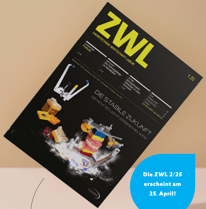
Mock-up: © Olivie Strauss - unsplash.com

SCANKATALOGE für eine effektive Kommunikation mit Labor und Patienten